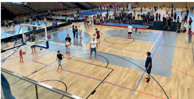
Sport Arena Wien - Drei Hallen und viel Raum für mehr als 20 Sportarten