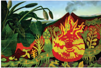
Vulkanische Landschaft (nach Caspar David Friedrich)

GALERIE ALTERLAA Kaufpark Alt-Erlaa Anton-Baumgartner-Straße 44 1230 Wien