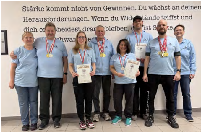
Medaillengewinner der Sportschützen Alterlaa

Bei der Wiener Landesmeisterschaft für Luftpistole 2026 konnten die Schützinnen und Schützen der Sportschützen Alterlaa (SAE) eindrucksvoll zeigen, dass sich konsequentes Training und Teamgeist auszahlen. Mit insgesamt zwölf Medaillen kehrte das Team von den Titeln zurück.