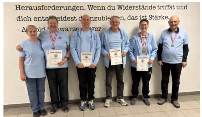
Medaillengewinner der Sportschützen Alterlaa

In der olympischen Disziplin Luftpistole wird auf eine Distanz von zehn Metern geschossen. Die Scheibe ist etwas größer als eine Postkarte, während der innerste Ring – der sogenannte Zehner – lediglich 11,5 Millimeter misst. Um konstant gute Ergebnisse